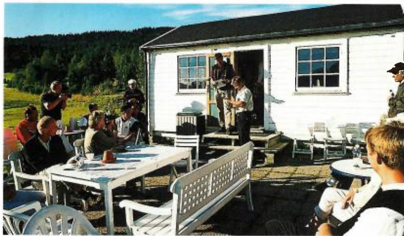
DET VESLE KLUBBHUSET: Klubbhuset ligger vakkert til, med hull 1 og hull 9 som nærmeste nabo, og bare noen få meter fra en fin drivingrange.