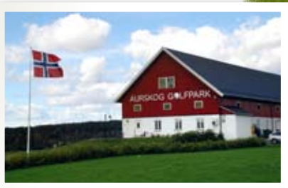
LÅVEN ER LANDEMERKET: Aurskog Golfpark er lett synlig fra riksvei 170.