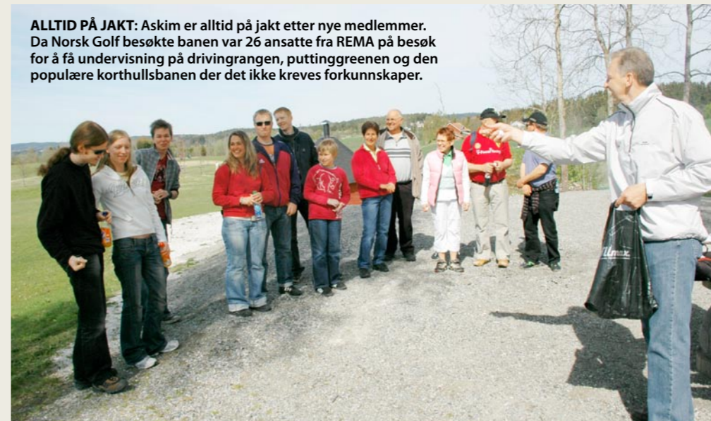
ALLTID PÅ JAKT: Askim er alltid på jakt etter nye medlemmer. Da Norsk Golf besøkte banen var 26 ansatte fra REMA på besøk for å få undervisning på drivingrangen, puttinggreenen og den populære korthullsbanen der det ikke kreves forkunnskaper.