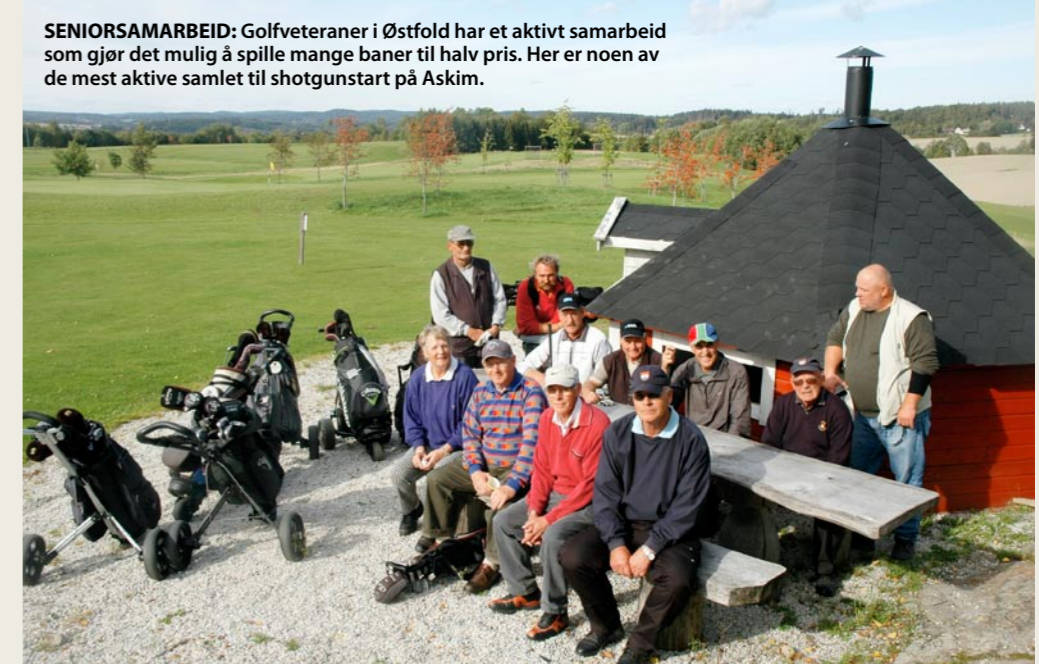
SENIORSAMARBEID: Golfveteraner i Østfold har et aktivt samarbeid som gjør det mulig å spille mange baner til halv pris. Her er noen av de mest aktive samlet til shotgunstart på Askim.