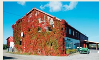
GOD PLASS: Det store servicebygget som huser både golfkøller, maskiner, restaurant og administrasjon.