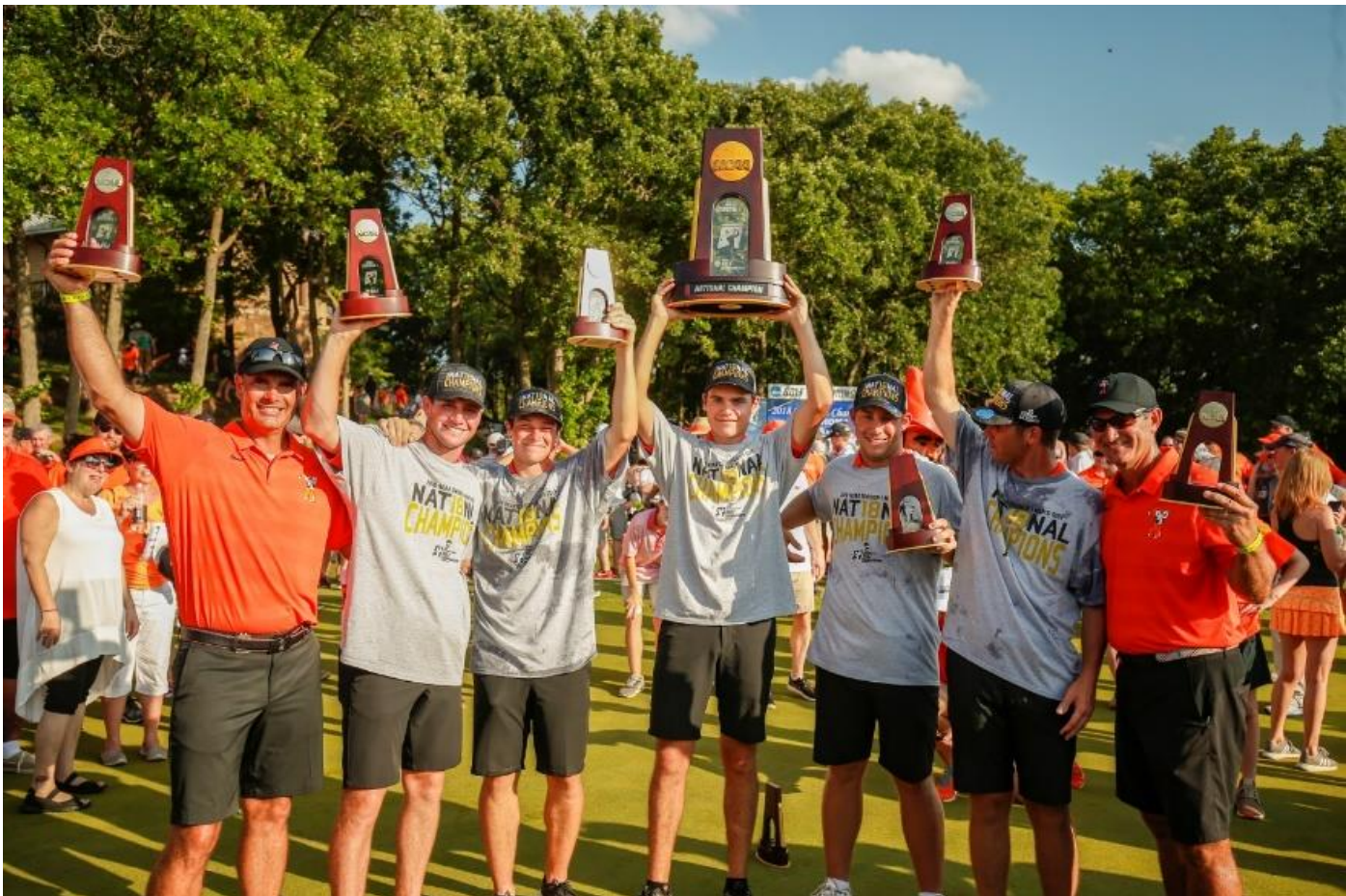
Viktor feirer sommerens NCAA-tittel sammen med lagkameratene sine. Laget er USA's soleklart beste collegelag.

Toppnivået på de beste spillerne er ganske likt. Men det er mye dypere felt her i USA. I Europa har man stort sett hørt om alle de gode spillerne, mens her kan det plutselig komme et helt ukjent navn ut av det blå som knuser alle. Det er når jeg har kommet hit at jeg har forstått hvor stor golfnasjon USA faktisk er. Det er mange av dem som ikke trener veldig mye, og på noen områder synes jeg flere norske spillere trener bedre. Men de har så sinnsykt mange som spiller golf, at de alltid kommer til å produsere gode spillere.