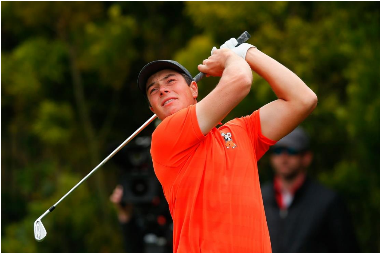
Torsdag 8. november debutterer Viktor Hovland på PGA-touren i Mexico.

– Han har utviklet ferdighetene sine, og han er mye tryggere på seg selv. Det smitter naturligvis over på resten av spillet hans. Han spiller med en mye større ro, og han blir ikke stresset av bogeyer, for han vet at birdiene alltid er rett rundt hjørnet. Jeg er så glad for at golfverden endelig har fått se hva han er i stand til på golfbanen, men også hvor ydmyk og flott person han er utenfor.